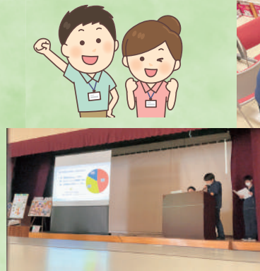
2月12日の信達福祉会の発表会にて、取組内容を発表してきました！