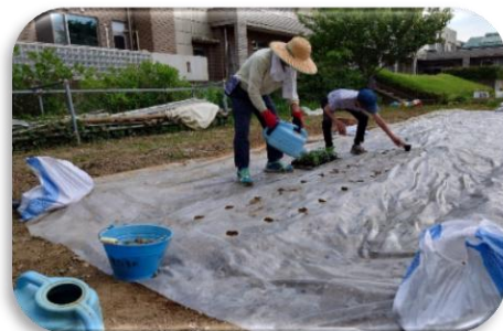
ケアハウスの畑栽培