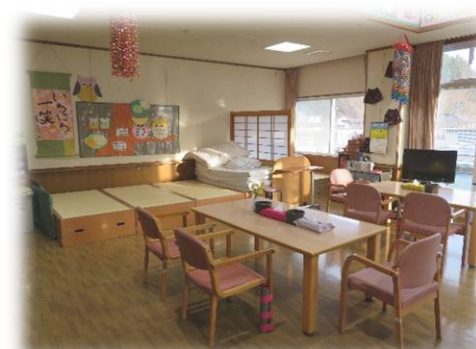
II型フロア 認知症対応型デイサービス