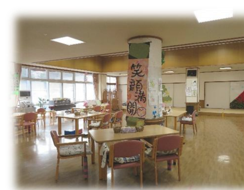
I型フロア 地域密着型デイサービス